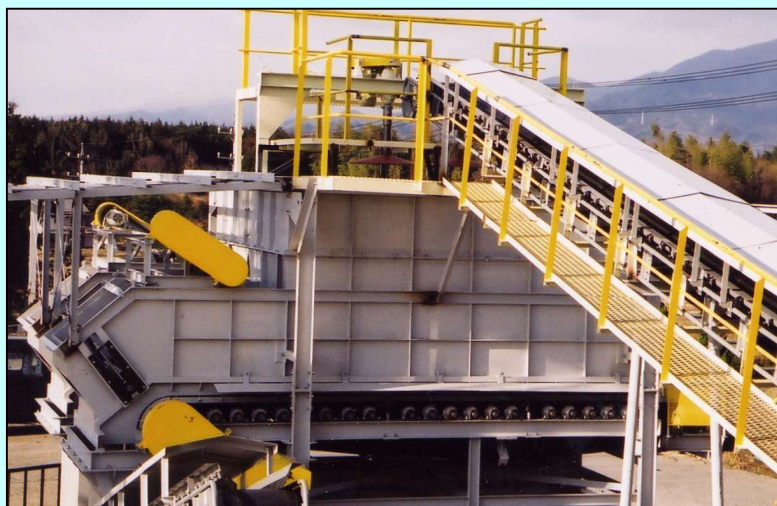
ホッパー貯留及び安定量払出装置