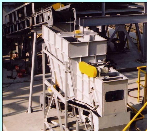
微量調整払出装置